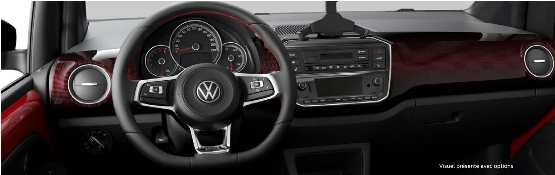
Visuel présenté avec options