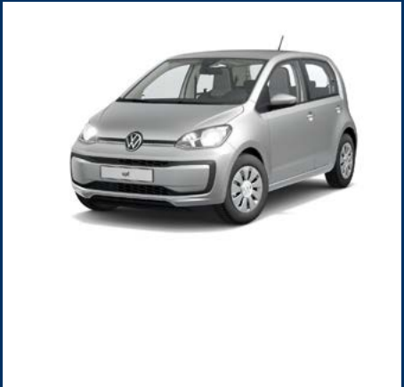
Roues Hiver 15" 'Merano'