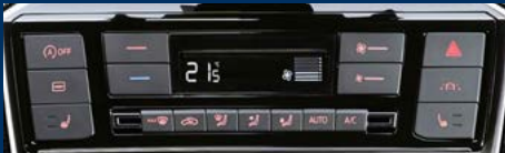
PH5 - Climatisation automatique 'Climatronic'