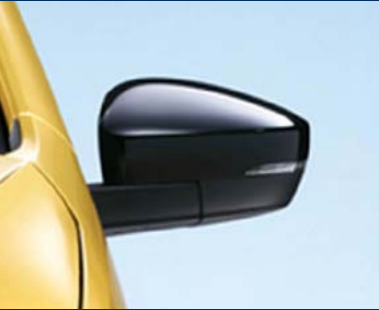
WW1 - Rétroviseurs réglables électriquement et dégivrants