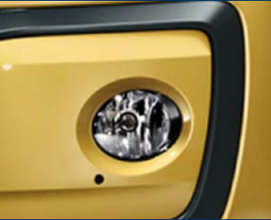
WW1 - Projecteurs antibrouillard