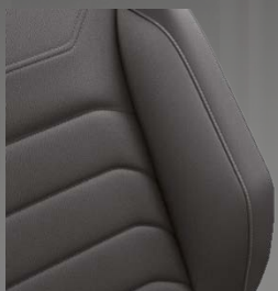
Cuir Vienna R-Line Noir Titane