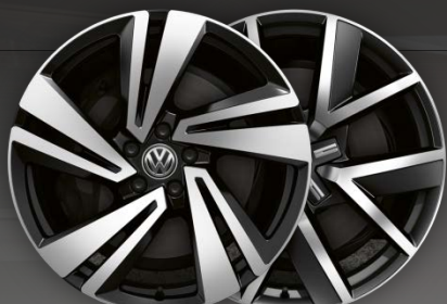
Jante en alliage léger 20" ,Nevada' ou ,Braga'