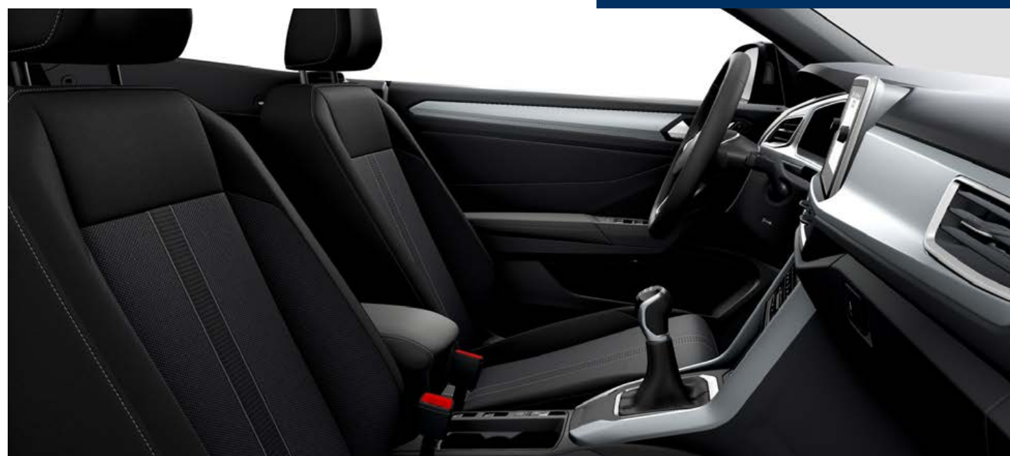
1 Sellerie en tissu "Tracks 2" noire