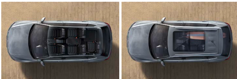
Configuration à 7 places avec un siège arrière rabattu. L'habitacle offre de la place pour une planche de surf