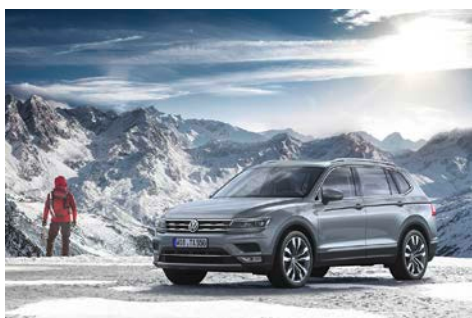
Tiguan Allspace Highline 4MOTION

4MOTION Active Control. Le 4MOTION Active Control avec sélection du profil de conduite est une particularité de tous les Tiguan Allspace à transmission intégrale. Ce système est piloté via un commutateur multifonction intuitif placé sur la console centrale. Le conducteur l'utilise pour activer les quatre modes supérieurs ainsi que les différents menus déroulants. S'il tourne le bouton vers la gauche, il accède aux deux profils de route « Onroad » et « Snow ». Lorsque le commutateur est tourné vers la droite, deux profils tout-terrain sont accessibles : « Offroad » (réglage automatique des paramètres tout-terrain) et « Offroad Individual » (réglages ajustables). En quelques secondes, tous les systèmes d'aide à la conduite pertinents sont ainsi adaptés au besoin de motorisation grâce au 4MOTION Active Control.