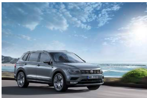
Tiguan Allspace Highline 4MOTION.