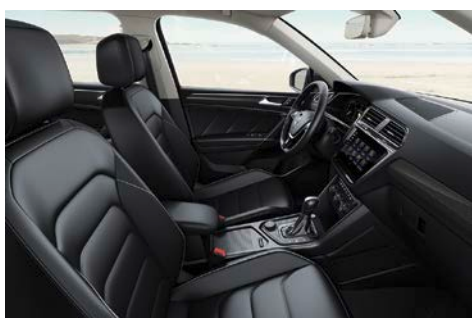
Habitacle équipé du nouveau « Discover Pro »