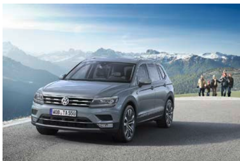
Tiguan Allspace Highline 4MOTION