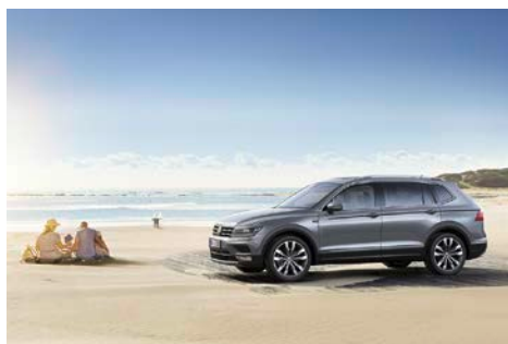
Tiguan Allspace Highline 4MOTION