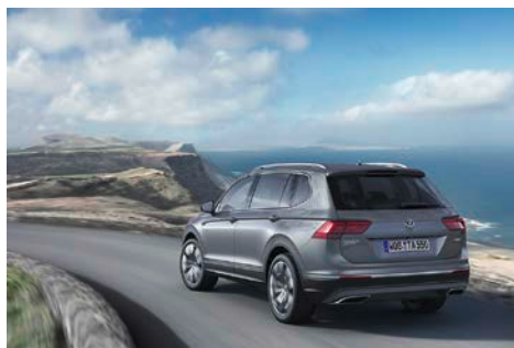
Tiguan Allspace Highline 4MOTION.