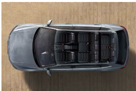
Habitacle dans la configuration à 7 places