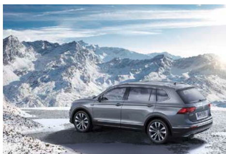
Tiguan Allspace Highline 4MOTION