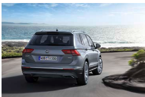
Tiguan Allspace Highline 4MOTION