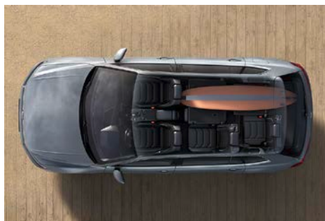
Sièges de la 2e et 3e rangée rabattables individuellement