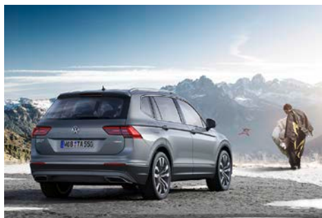
Tiguan Allspace Highline 4MOTION

Deux parties avant. Tout comme le Tiguan « classique », le Tiguan Allspace est disponible avec une partie avant pour la route et une pour le tout-terrain. Cette dernière peut être commandée dans le cadre du « pack off-road » en option avec un carénage inférieur de protection du moteur s'étendant jusqu'au pare-chocs et spécialement conçu pour la conduite tout-terrain. La partie avant off-road améliore l'angle d'attaque avant de 7 degrés.