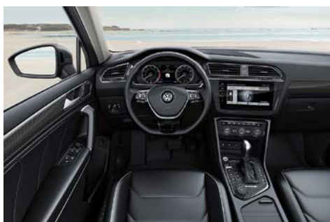
Habitacle équipé de l'« Active Info Display » et du « Discover Pro »

« Intuitive Usability » (« Ergonomie intuitive »). De nombreux affichages et commandes digitaux sont disponibles sur le nouveau Tiguan Allspace. Cela