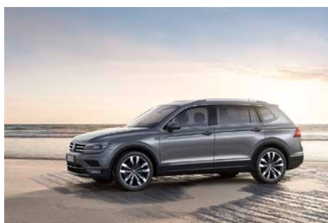
Tiguan Allspace Highline 4MOTION

Tiguan Allspace Highline. Le Tiguan Allspace Highline occupe le haut de la gamme. Ici aussi, la ligne d'équipements a été enrichie par rapport au Tiguan classique (NWB). Parmi les équipements de la finition Highline (venant s'ajouter à ceux de la finition « Comfortline »), on trouve déjà sur le Tiguan classique les jantes en alliage léger de 18", un spoiler avant argenté, les barres de toit argentées, des phares à LED, des feux arrière full LED (fonctions LED avancées avec alternance marquée entre la signature lumineuse des feux arrière et celle des freins), un éclairage d'ambiance, un volant multifonction et un pommeau de levier de vitesse en cuir ainsi que le contrôle dynamique de châssis DCC. En Allemagne, le régulateur automatique de distance « ACC » et l'« Air Care Climatronic » sont de plus à