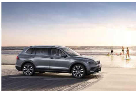
Tiguan Allspace Highline 4MOTION