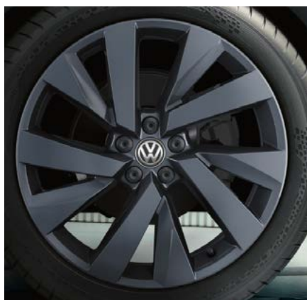
Jantes en alliage léger 18" 'Funchal' argent adamantium