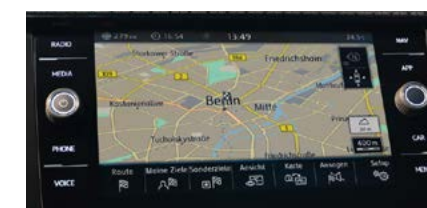
Radionavigation 'Discover Media' 8''