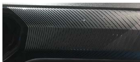
Application décorative 3D 'Transition'