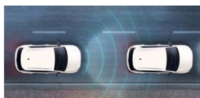
ACC : régulateur de vitesse adaptatif