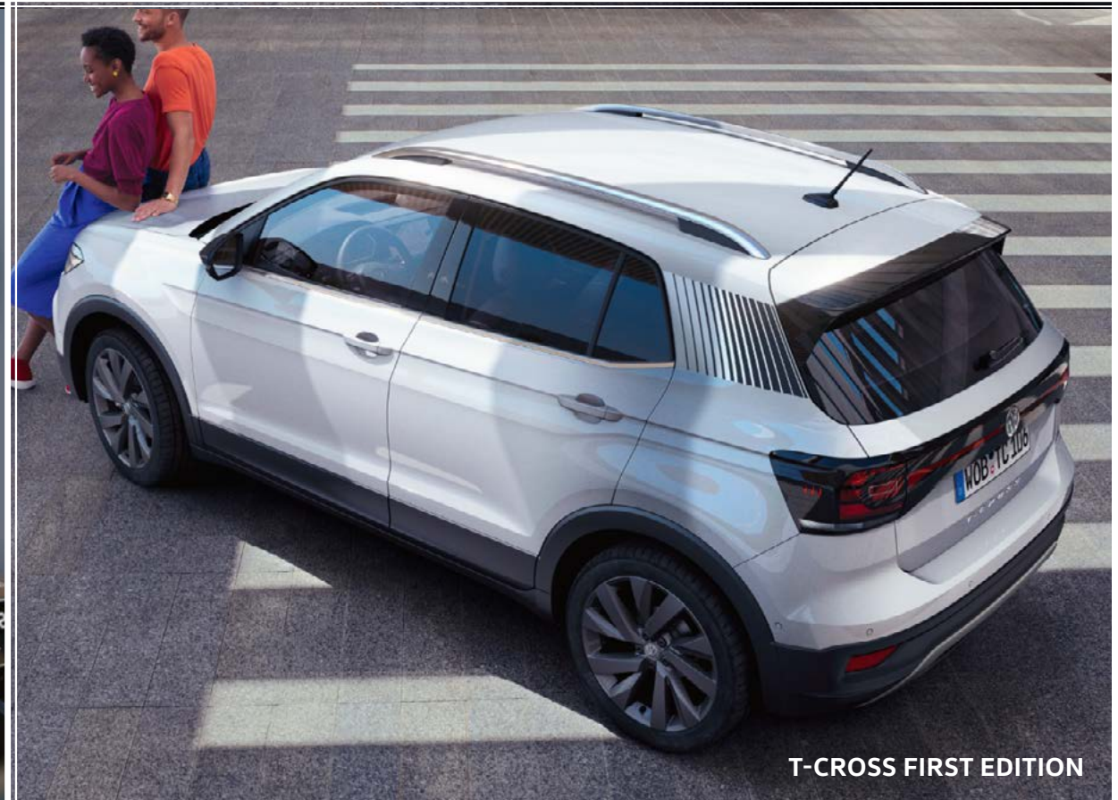
T-CROSS FIRST EDITION