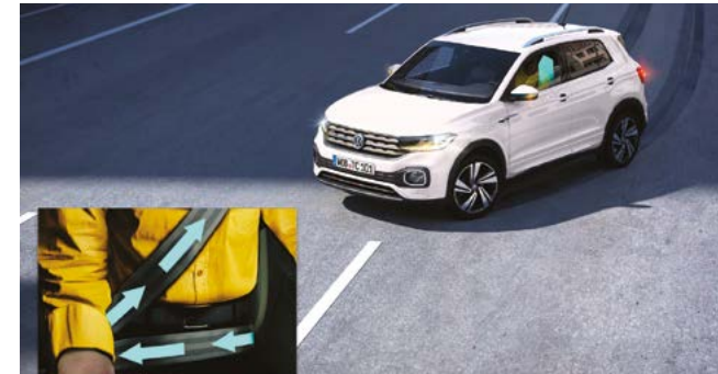
Pre Safe Assist