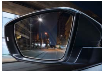
Détecteur d'angle mort 'Blind Spot Detection'