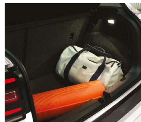
Coffre de 385L à 455L