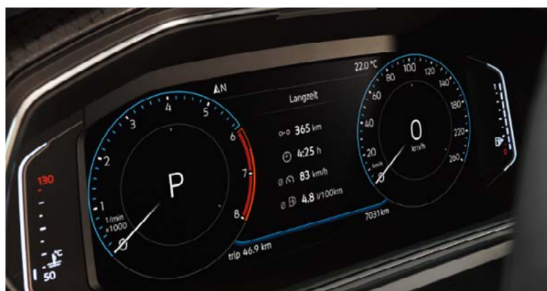
Active Info Display 100% digital