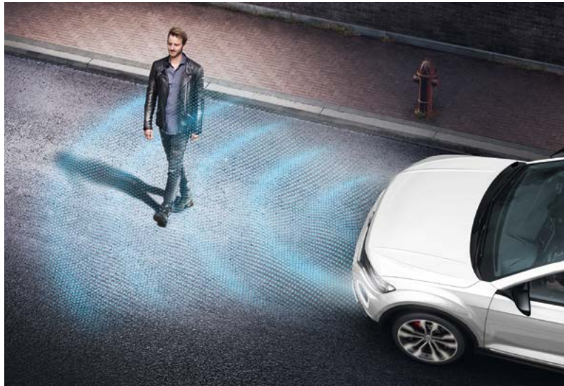
Front Assist avec détection des piétons