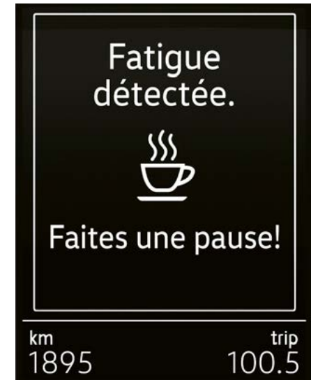
Détection de fatigue