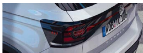
Feux arrière à LED avec bandeau réfléchissant