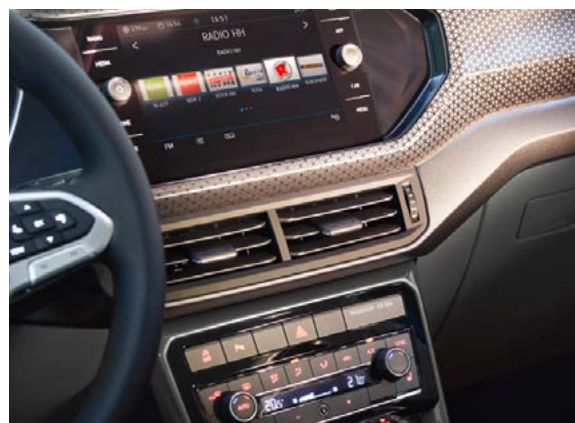
Climatisation automatique bi-zone et dalle tactile d'infotainment 8"