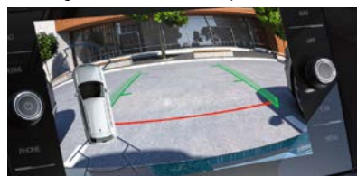
Camera de recul 'Rear view'