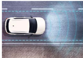
Lane Assist: assistant de maintien de trajectoire