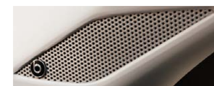
Système Beats Audio 300w