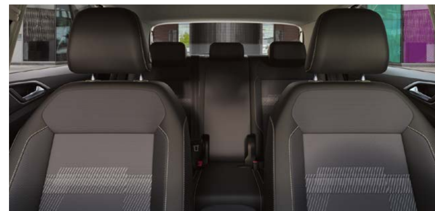
Sellerie spécifique avec sièges chauffants